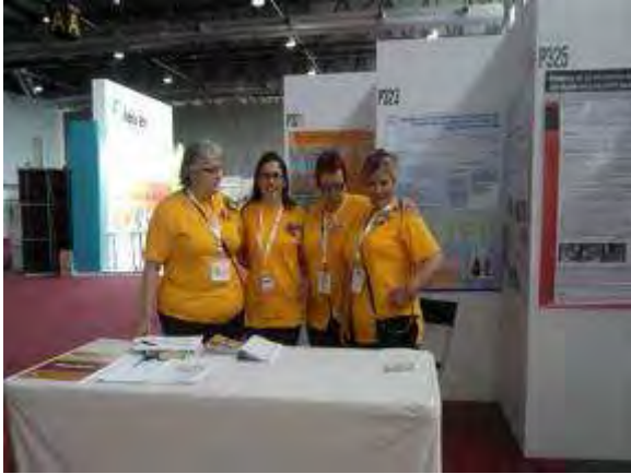
Voluntarias en la zona de los posters