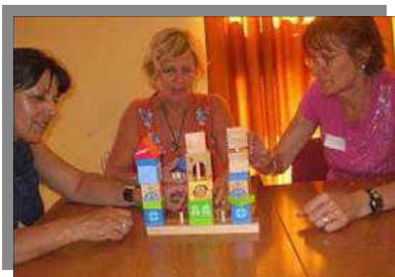
Trabajando en equipo