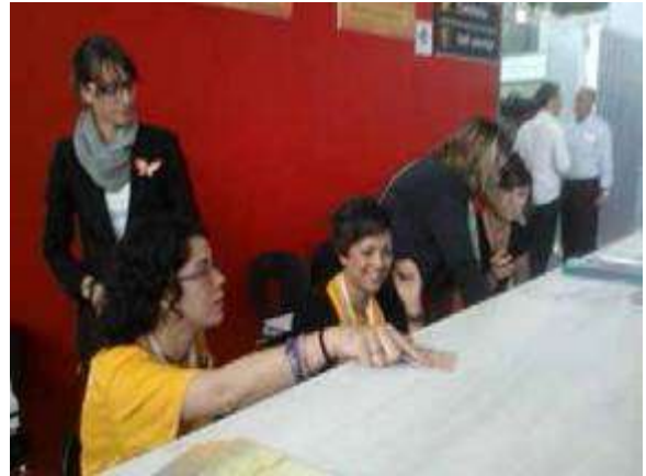
Voluntarias en zona de acreditaciones