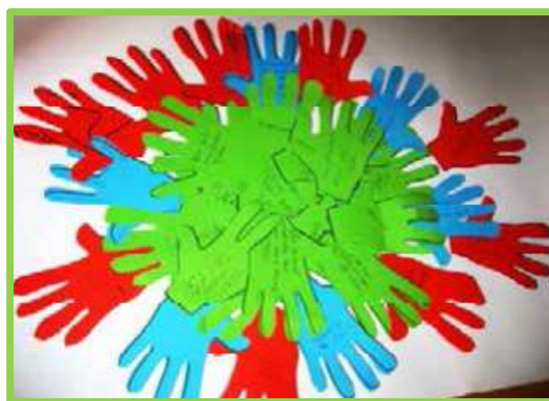
Fotografía de las manos en las que los voluntarios y voluntarias expresaron sus dificultades y sus deseos para el futuro

A lo largo del encuentro, l@s voluntari@s tuvieron la oportunidad de compartir experiencias, expresar deseos para el futuro así como problemas que afectan a sus labores altruistas, resultando un momento colorido y componiendo la imagen de un voluntariado donde existen personas de muy diferentes edades, procedencias, formación, motivaciones pero, ante todo, unidos por la pasión que ponen en las tareas solidarias que realizan.