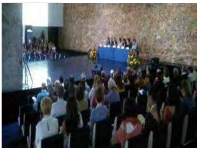
Acto de inauguración