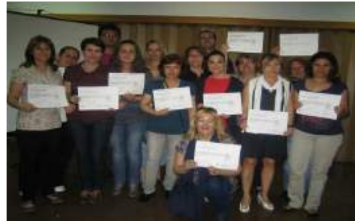
Navalmoral de la Mata , 11, 12, 13 17 y 14 de abril. 15 voluntarios/as