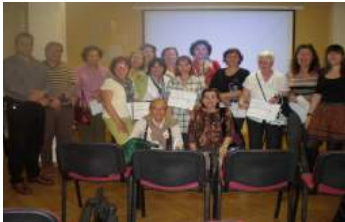
Cáceres , 4, 5, 6 y 7 de abril. voluntarios/as.